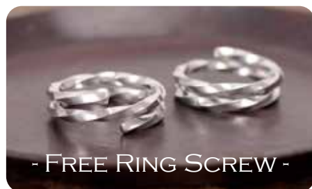
フリーリング・スクリュー [Silver950]