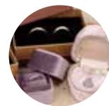
ギフトボックス/ポーチ

・ギフトボックス 1個 ¥300 (税抜 ¥273)～ ・リングケース 1個 ¥1,200 (税抜 ¥1,091)～ ・スエードポーチ 1枚 ¥700 (税抜 ¥636)～