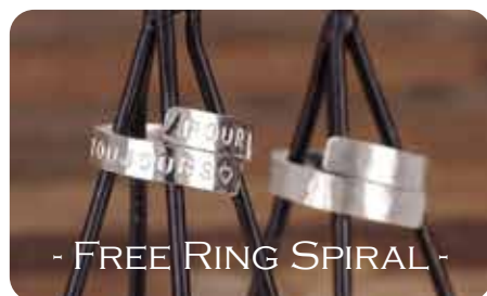
フリーリング・スパイラル [Silver950]