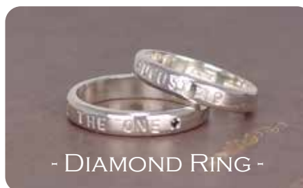
ダイヤモンドリング [Silver950]