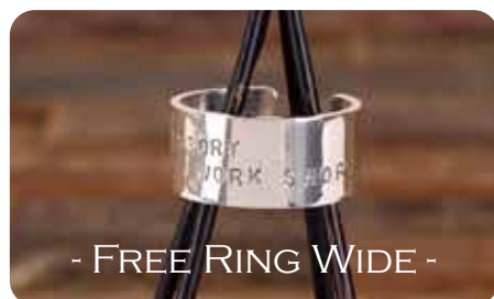
フリーリング・ワイド [Silver950]

サイズ：9号～21号 (22号～27号：+¥200) 1本 ¥5,500 (税抜 ¥5,000)