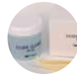
シルバー液体クリーナー

・ギフトボックス 1個 ¥300 (税抜 ¥273)～ ・リングケース 1個 ¥1,200 (税抜 ¥1,091)～ ・スエードポーチ 1枚 ¥700 (税抜 ¥636)～