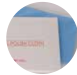
シルバーポリッシュクロス