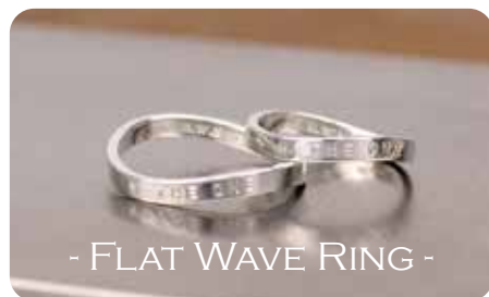
フラット・ウェーブリング [Silver950]

- RING MAKING - シンプルで着けやすく、馴染みやすいボリューム感！ チェーンを通してペンダントにも！