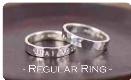
レギュラーリング [Silver950]