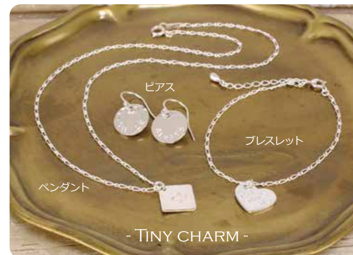
タイニーチャーム [Silver950]

- TINY CHARM MAKING - 小ぶりのデザインが可愛いTINYシリーズ♪